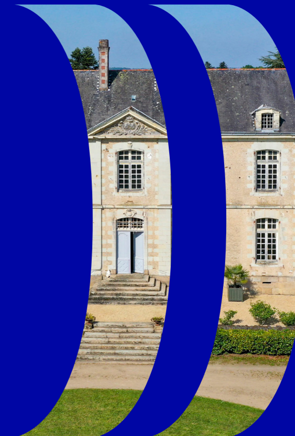
Photo de couverture : Bessé-sur-Braye © Région Pays de la Loire / PB Fourmy